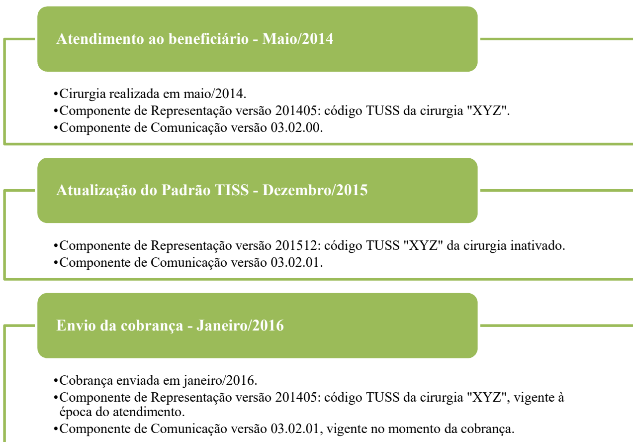
Figura 2 – Troca de informações em diferentes versões dos Componentes

175. O esquema abaixo ilustra a troca de informações em diferentes versões dos Componentes do Padrão TISS. Destacamos que as datas colocadas no esquema abaixo são apenas para exemplificar o processo: